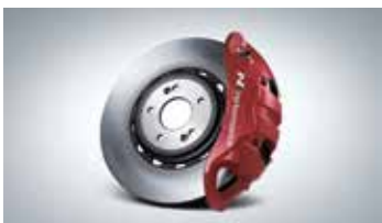
모노블록 4P 캘리퍼 / 하이브리드 디스크 / 로우 스틸 패드