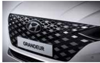
반광 크롬 라디에이터 그릴