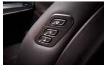
동승석 워크인 스위치 / 동승석 릴렉션 콤포트 시트