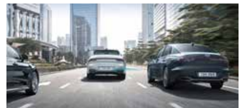
후측방 충돌방지 보조