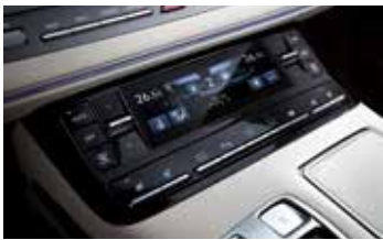
공기 청정 시스템 (듀얼 풀오토 에어컨 / 터치식 공조 컨트롤러 적용)