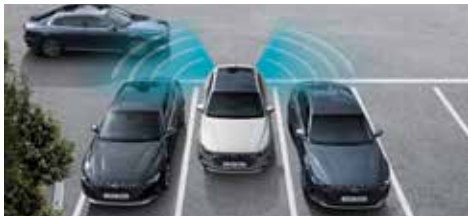
후방 교차 충돌방지 보조