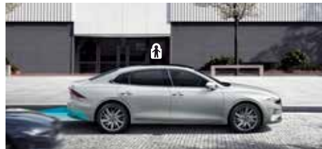
안전 하차 보조