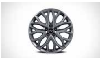
19인치 실버톤 경량 휠 * 휠 단품 구매 가능 [75만원]

※ 모노블록 브레이크 & 패키지에는 프론트에만 적용되며 브레이크 패드는 소모성 부품이므로 보증이 적용되지 않습니다. ※ 모노블록 브레이크 & 패키지는 성능 특성상 소음이 발생할 수 있으며, 고성능 패드 특성상 분진 발생으로 주기적인 휠 세척이 필요합니다. ※ 모노블록 브레이크 & 패키지 및 19인치 실버톤 경량휠은 19인치 휠을 선택하여야 적용 가능합니다.