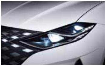
Full LED 헤드램프