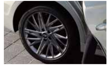
캘리그래피 전용 19인치 스피터링 알로이 휠