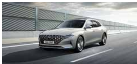
고속도로 주행 보조