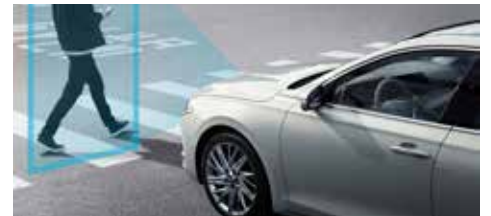
전방 충돌방지 보조