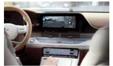
서라운드 뷰 모니터