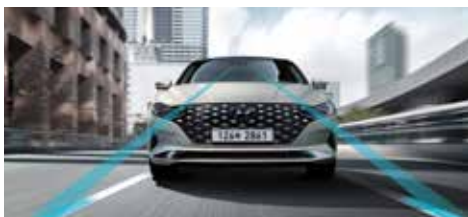
차로 유지 보조