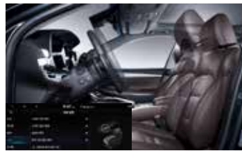
운전석 자세 메모리 시스템 (스마트 자세제어 2세대 포함)