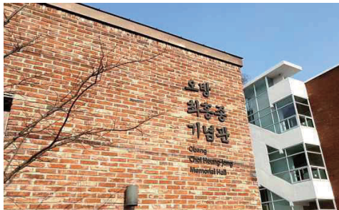
2022년 5월 16일 광주시 남구청에서 지어 개관한 오방 최흥종 기념관