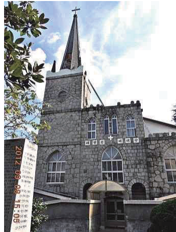
최흥종 목사에게 의해 세워진 여수 나환자촌 애양원교회