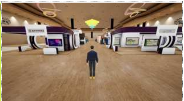
【 온라인 전시관 내부 전경 】

□ 대학혁신지원사업(2019~2021)은 국가 혁신성장의 토대가 되는 미래 인재 양성 기반을 구축하고 대학의 자율적인 혁신을 지원하기 위해, 2019년 기존의 특수목적지원사업들을 통합하여 일반재정지원사업으로 출범하였다.