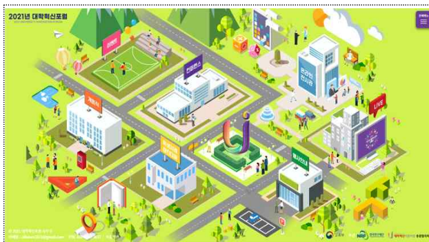
【 대표 누리집 】

□ 한편, 사업참여 대학 143개교의 성과 전시관을 온라인 3차원(3D)으로 구축하여 대학 관계자뿐만 아니라 일반 국민들도 각 대학의 성과를 관람하고 다른 관람객과 의견을 나누며 소통할 수 있다.