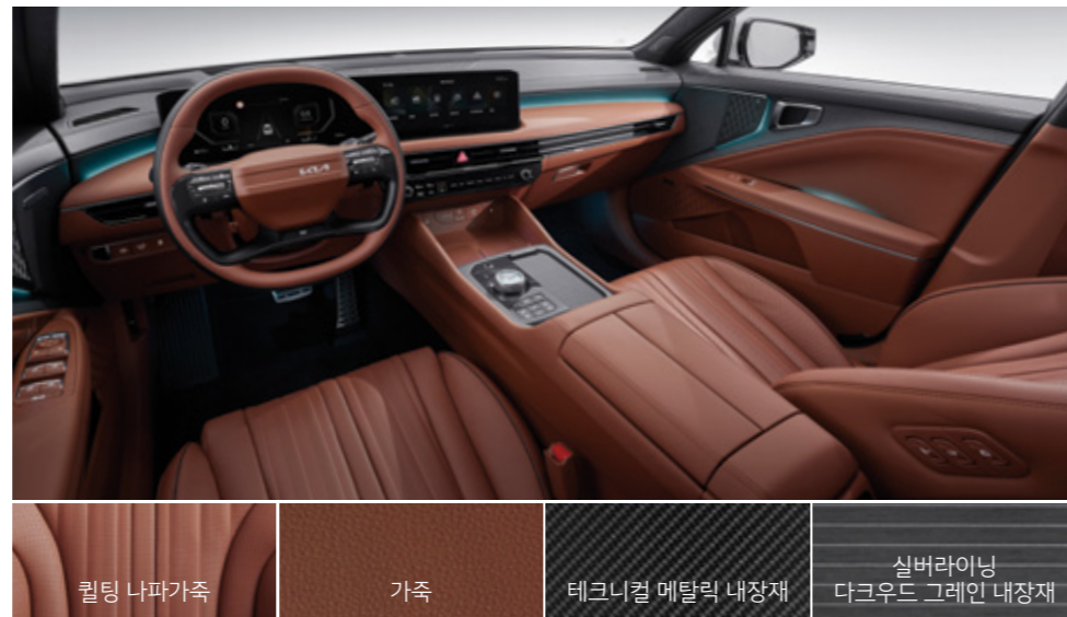
라운지 브라운 투톤 인테리어