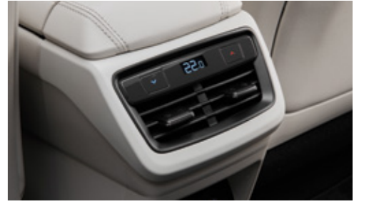
3존 공조 (뒷좌석 온도제어)