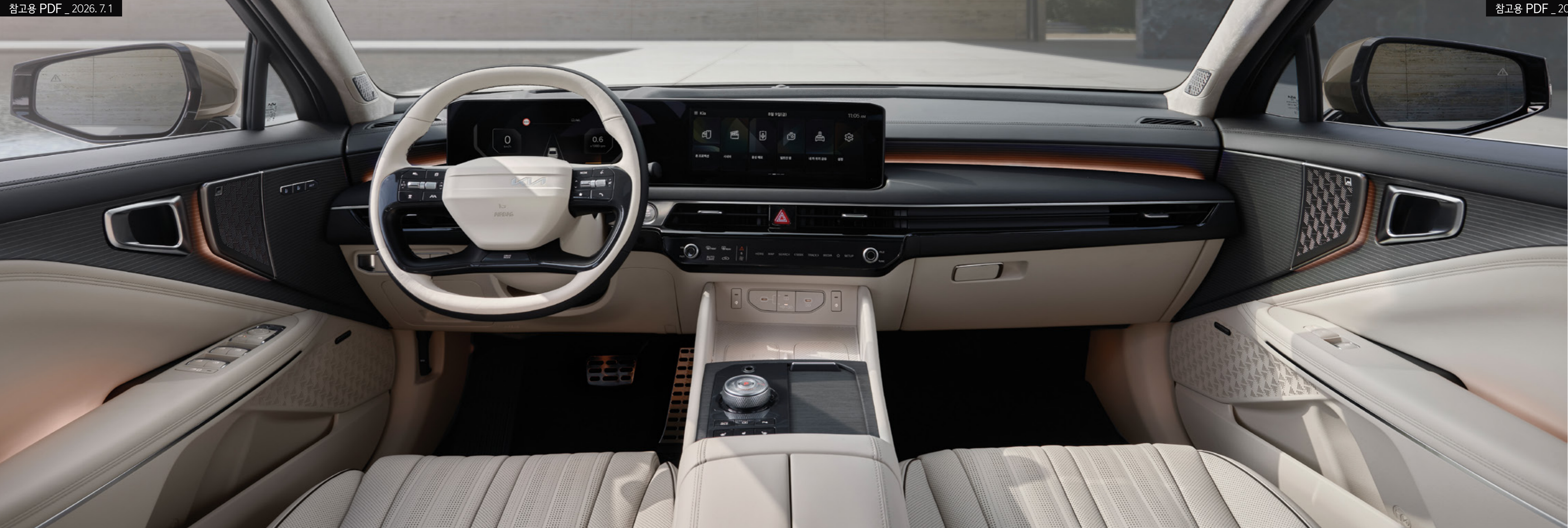
3.5 가솔린 _ 뉴트럴 베이지 투톤 인테리어 / 상기 사양구성은 트림, 엔진 및 선택 사양에 따라 다르게 적용됩니다.