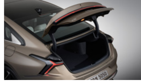
스마트 파워 트렁크