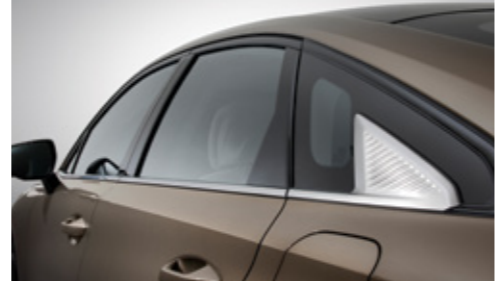
이중접합 차음 글라스