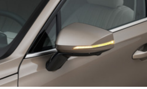
LED 리피터 일체형 아웃사이드 미러