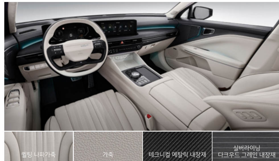
뉴트럴 베이지 투톤 인테리어