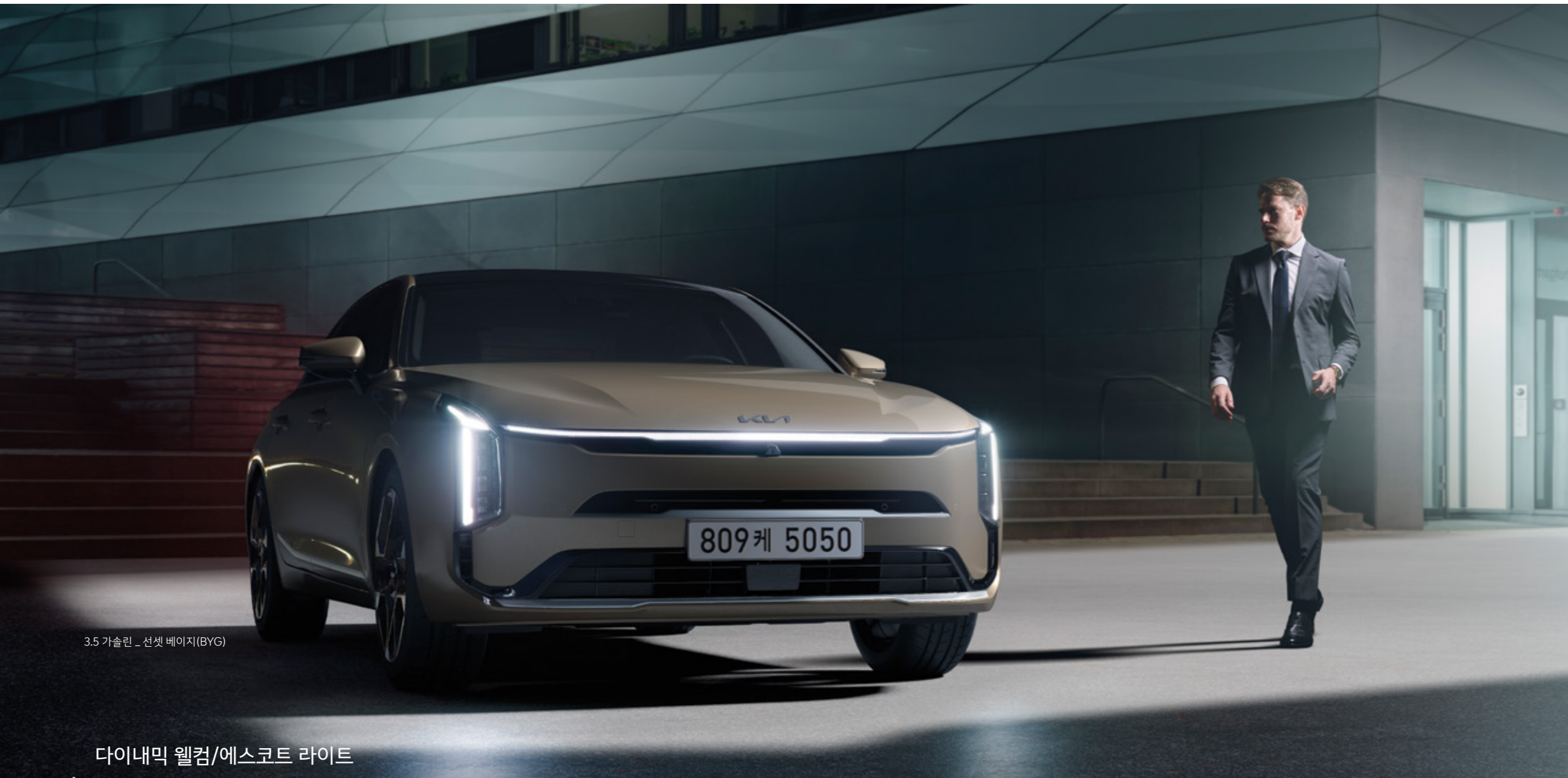
3.5 가솔린 _ 선셋 베이지(BYG)