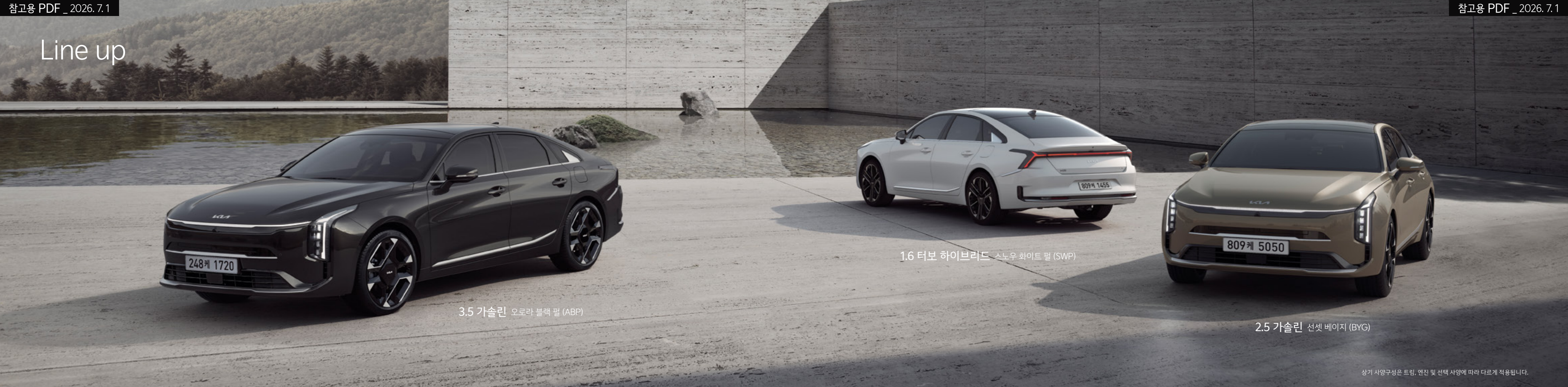
3.5 가솔린 오로라 블랙 펄 (ABP) 248케 1720