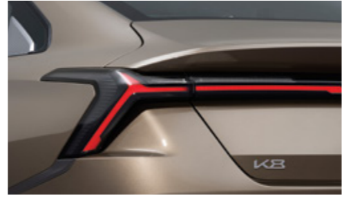
LED 리어 콤비네이션램프