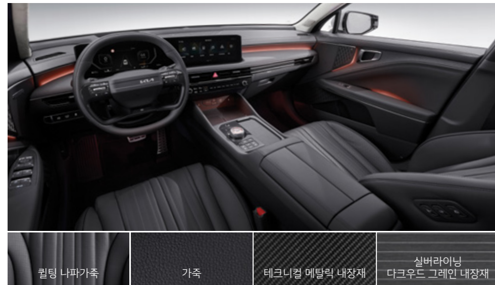
블랙 원톤 인테리어