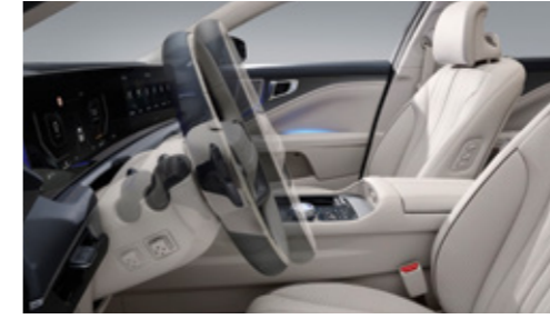
전동식 틸트/텔레스코픽 스티어링 휠*