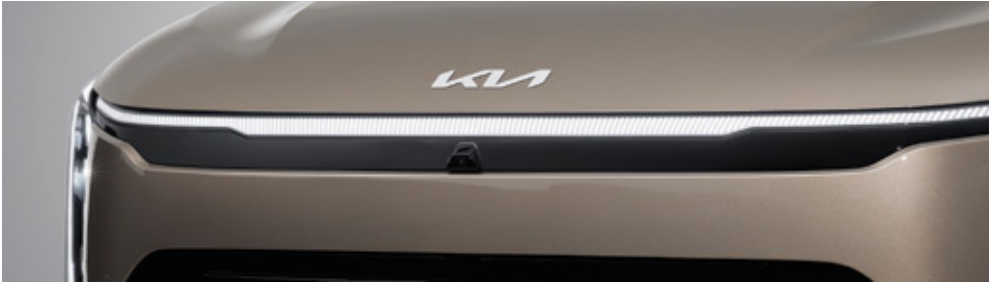
LED 센터 포지셔닝 램프