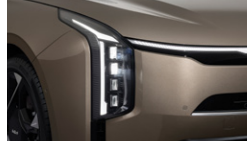
프로젝션 LED 헤드램프