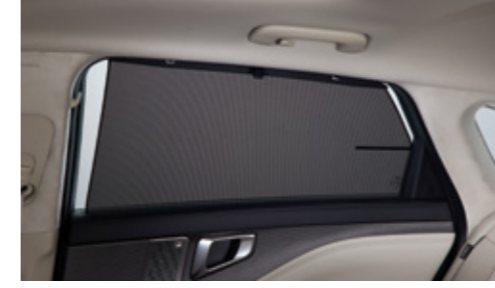
뒷좌석 측면 수동 섀커튼