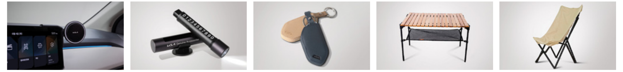
디스플레이 휴대폰 거치대 비상탈출키 가죽 키케이스 모카롤 테이블 버터플라이 체어