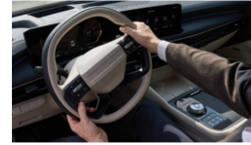
랙 구동형 전동식 파워 스티어링 (R-MDPS)