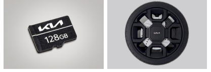
빌트인 캠 2 전용 SD카드(128GB) 휠 디자인 디퓨저