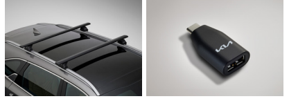
크로스바 C to USB-A 변환젠더